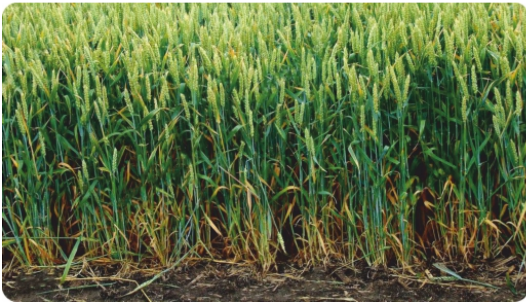
Saatgut mit Bacto-seed gegen Fusarium behandeln.

Beschichtung oder Beize von Pflanzensaatgut ist ein alter und gut bekannter Prozess. Es heißt, dass die verschiedenen Materialien, die für die Saatgutbehandlung zum Schutz vor Pflanzenkrankheiten verwendet werden, eine schnellere Keimung und gesteigerte Erträge verstärken.